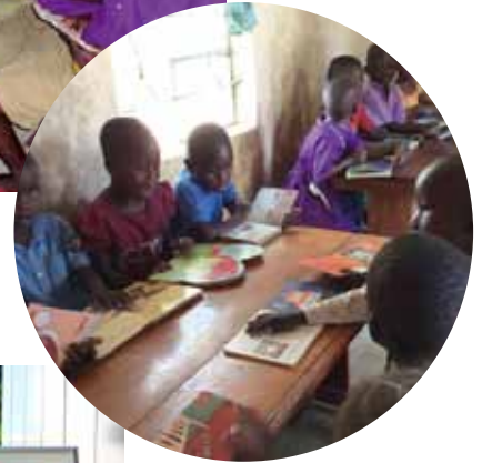
エンザロのドリームライブラリー (左)と、シャンダのドリームライブラリー (中央・右下)で、本を楽しむ子どもたち。