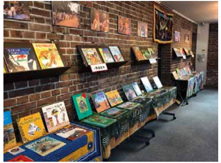
歴史を感じる赤煉瓦造りのスコットホールギャラリーに、アフリカの布や小物をあしらいながらの展示。